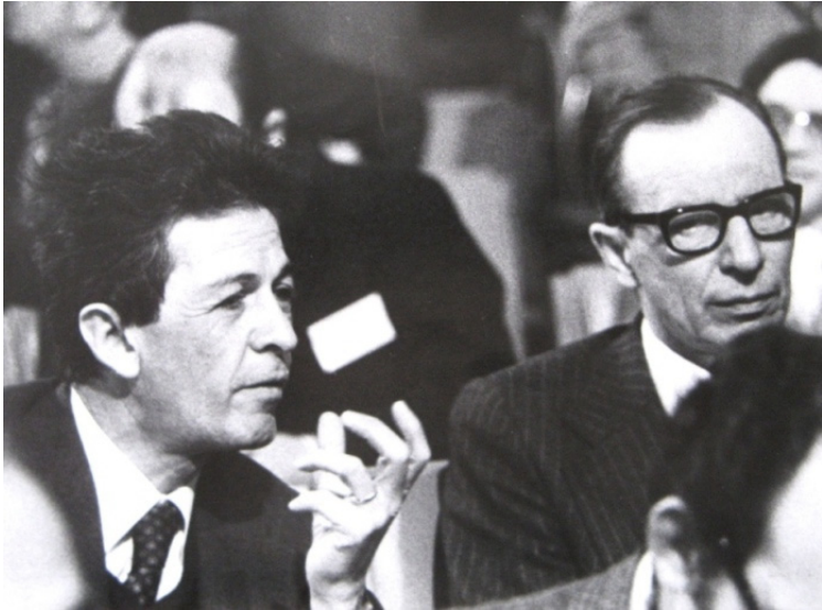
Giuliano Pajetta con Enrico Berlinguer