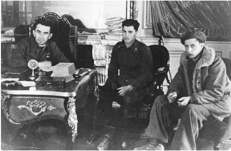
Giuliano Pajetta in Spagna con Luigi Longo